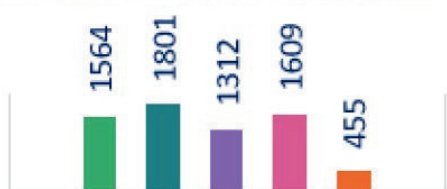
MOYENNE PAR JOUR ET PAR SITE JUIN

Une forte fréquentation des restaurants de l'entreprise 3 jours par semaine :