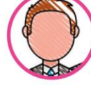
Pourquoi pas vous ?